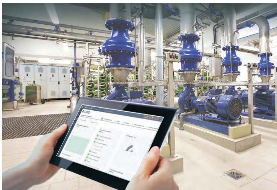
Рис. 5. Удаленный мониторинг с помощью решения Cloud-Control

она может измеряться миллионами рублей ежемесячно.