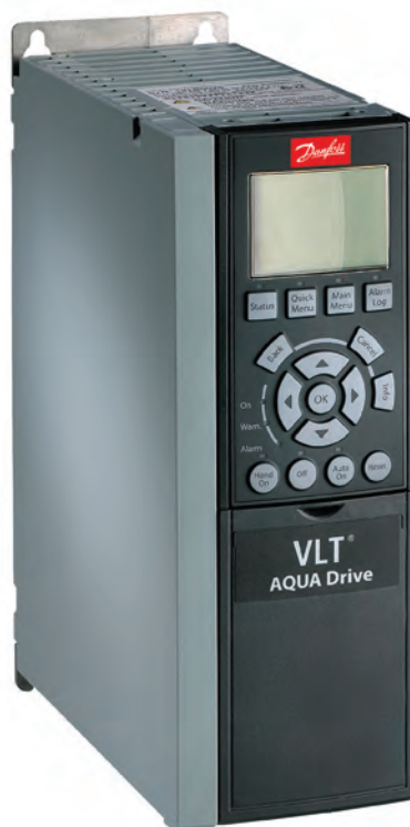
Рис. 1. Частотно-регулируемый привод ALT AQUA Drive от компании «Данфосс»

В основном продукты компании «СИНТО» устанавливаются в глубине инженерных сооружений, что делает визуальную индикацию работы менее значимой, а диспетчеризацию — необходимой. При этом распространенные системы диспетчеризации обладают рядом недостатков. Прежде всего, это увеличение количества оборудования и необходимость писать специальное ПО.