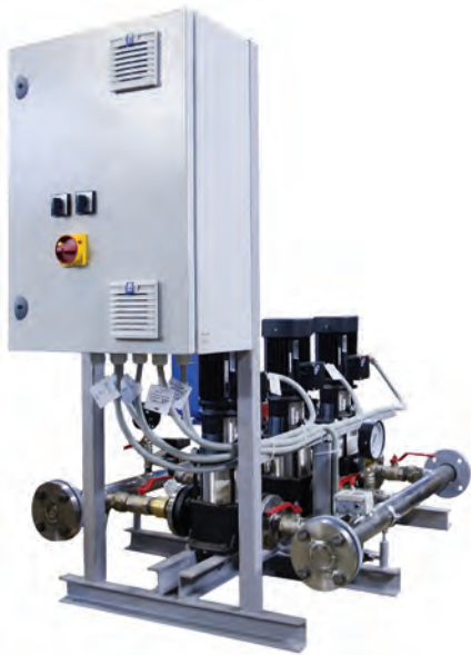
Рис. 2. Насосная установка «ГидроСи» со щитом управления